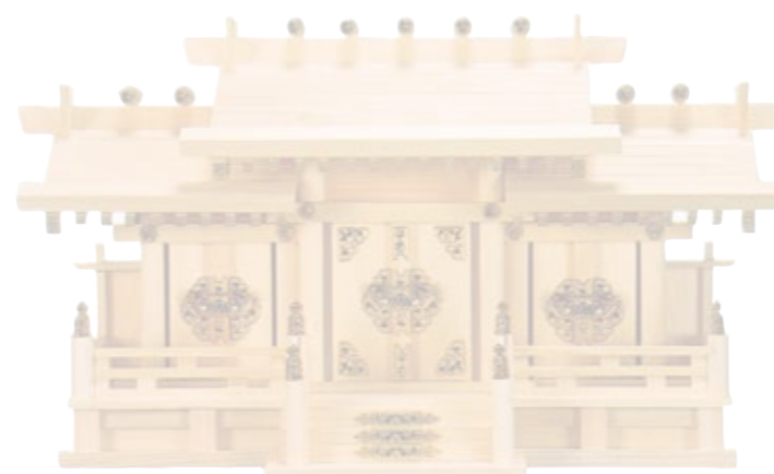
36002 屋根違い三社(新けやき)