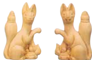
37009 木彫きつね(一対) 寸法 3