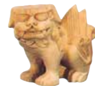
37008 木彫狛犬(一対) 寸法 3