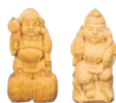
37010 木彫恵比須大黒 寸法 3