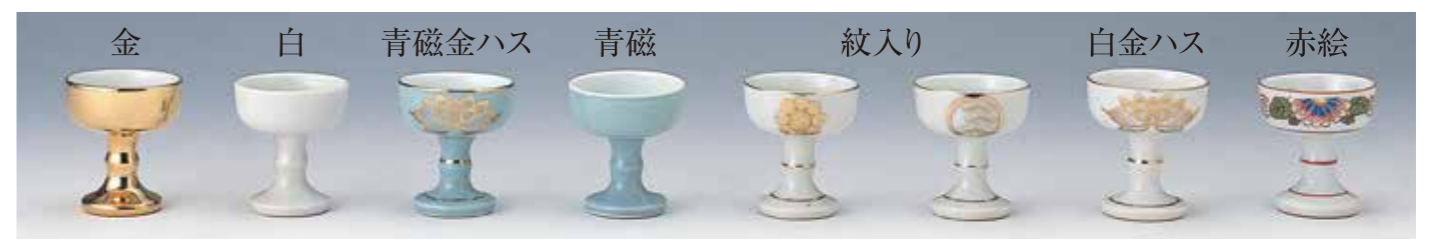
[31013] 仏器 寸法 小 中 大