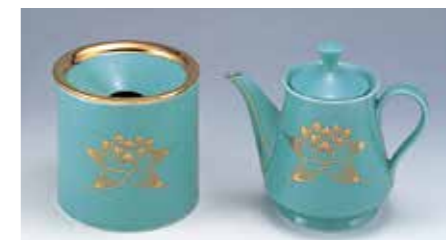
[31006] 青磁水差しセット