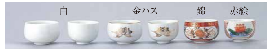
[31009] 千茶 寸法 2.4 2.6