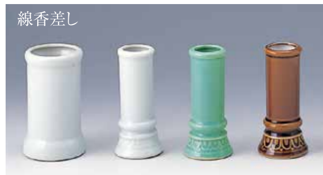
線香差し [25001] 太口 白 [25002] 白 [25003] 青磁 [25004] 茶 青磁も同サイズ ございます。