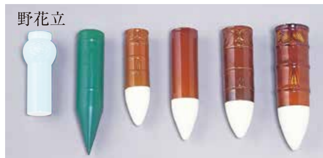
野花立 [25014] 青磁 [25015] プラスチック [25016] 小 [25017] 中 [25018] 大 [25019] 特大