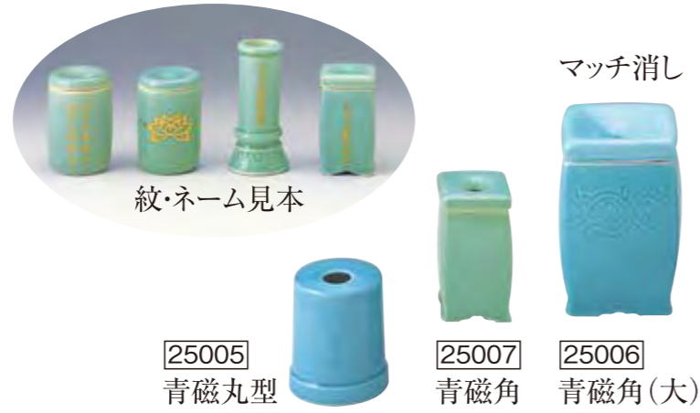
マッチ消し 紋・ネーム見本 [25005] 青磁丸型 [25007] 青磁角 [25006] 青磁角(大)