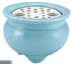
[25020] 墓前香炉 穴アキ 寸法 3.5