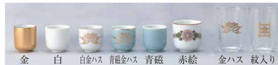
[31010] 湯呑 寸法 正1.6 正1.8 孫 京 2 2.2 2.4