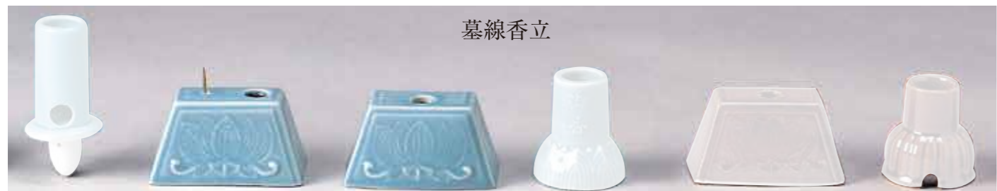
墓線香立 [24016] 青磁筒型 [24017] 青磁角型(ローソク立付) [24018] 青磁角型 [24019] 青磁丸型(大) [24021] 茶角型 [24022] 茶丸型(大)