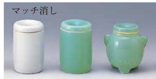
マッチ消し [25008] 白切立 [25009] 青磁切立 [25010] 青磁ダルマ