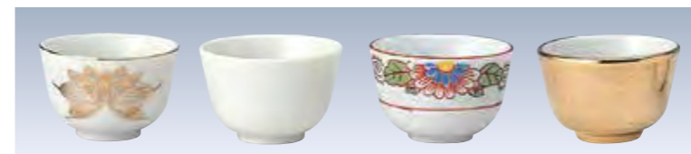
[31007] 大深(金ハス) 大深(白) 大深(赤絵) 大深(金)